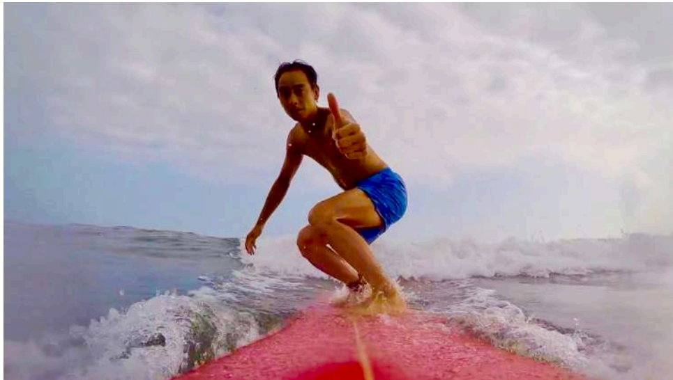
表 現の方ではなく、本物の波に乗っているだけです。失礼いたしました。笑 「なかなか上達の兆しが見られない」と書いたのは先月号でしたが、黒くてデカイ、マッスル力もコーチに指導していただき、テイクオフを(少しだけ)マスターしました。やはり、余計な力が入っていたようです。…海にいると色々なことが勉強になります。この日、一番の学習は「流れに逆らわない」ということ。森羅万象、全てのものが「呼吸」しています。その「呼吸」をやさしく感じ取り、それと一体化することが何よりも大事だということです。仕事も、遊びも…ですね？コーチ！